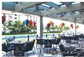
レストラン(イメージ)