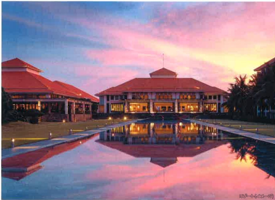
リゾート(イメージ)