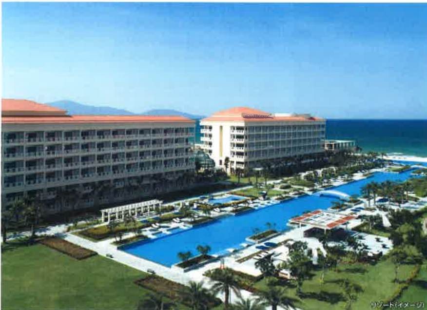
リゾート(イメージ)