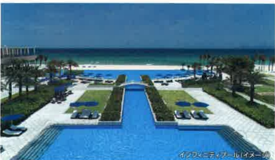
インフィニティプール(イメージ)