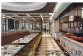
レストラン(イメージ)

SHERATON GRAND Danang Beach Resort & Spa