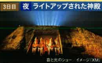
音と光のショー イメージ(XM)

夜は音と光のショーでライトアップされた幻想的な姿を、早 朝は朝日を浴びて真っ赤に染まる荘厳な姿をお楽しみいた だきます。*天候によってご覧いただけない場合があります。