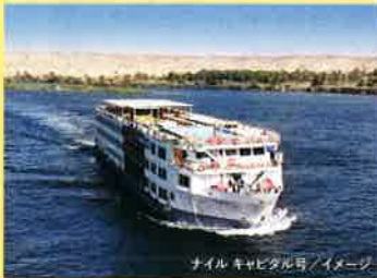
ナイル キャピタル号 / イメージ

雄大なナイル川と、兩岸の緑豊かで 長閑な風景を楽しみながら、設 備の整った船内でゆったりした時 間をお過ごしください。