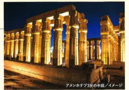
アメンホテプ3世の中庭 / イメージ

神聖な遺跡が幻想的に浮かび あがる、夜のライトアップ時にご 案内します。特に64本の開花式 パピルス柱が並び建つ「アメンホ テプ3世の中庭」は、日中よりも 圧倒的に神秘的な姿を見せてく れます。