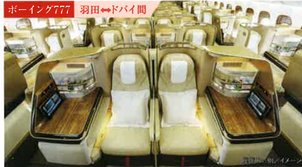
ボーイング777 羽田⇄ドバイ間